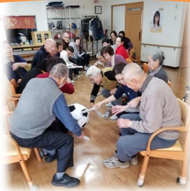
遊ビリレーション！