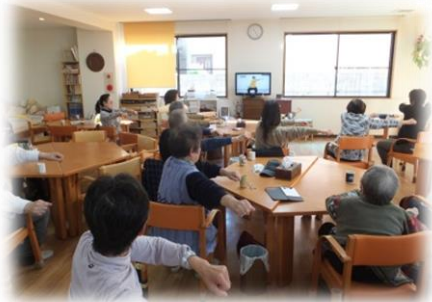
いきいき百歳体操！