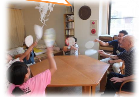
お子様もどうぞ♪ 一緒に遊びましょう！