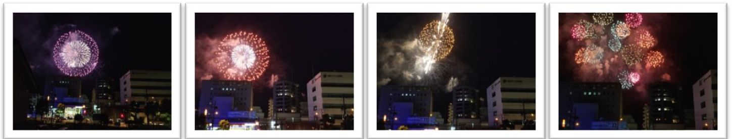
↑ 昨年の花火。まつもと2階のバルコニーから撮影 ↑

8月8日（木）のびわ湖大花火大会の日、 まつもと開設史上初の花火鑑賞会を開催します！ まつもと2階のバルコニーから一緒に花火を見ませんか？ ビルの際間から見える花火がほとんどになりますが、時々はきれいに見えます。 飲み物とおつまみを用意してお待ちしています♪